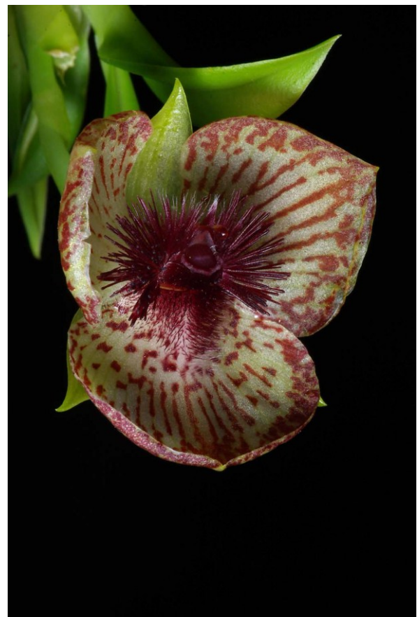
Behaarte Blütenteile der neuweltlichen Orchidee Telipogon collantesii täuschen Fliegenweibchen vor