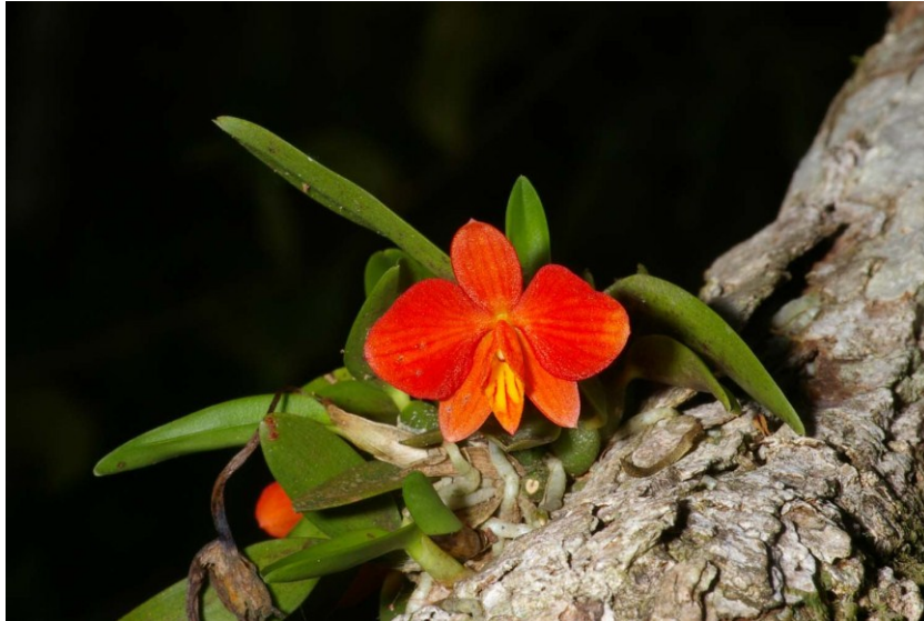
Plakative Farben locken neugierige Kolibris zu nektarlosen Blüten von Sophronitis pygmaea