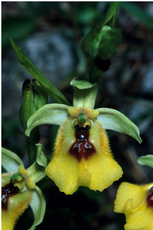
Billiger Sex - die mediterrane Orchidee Ophrys lacaitae verführt naive Wildbienen