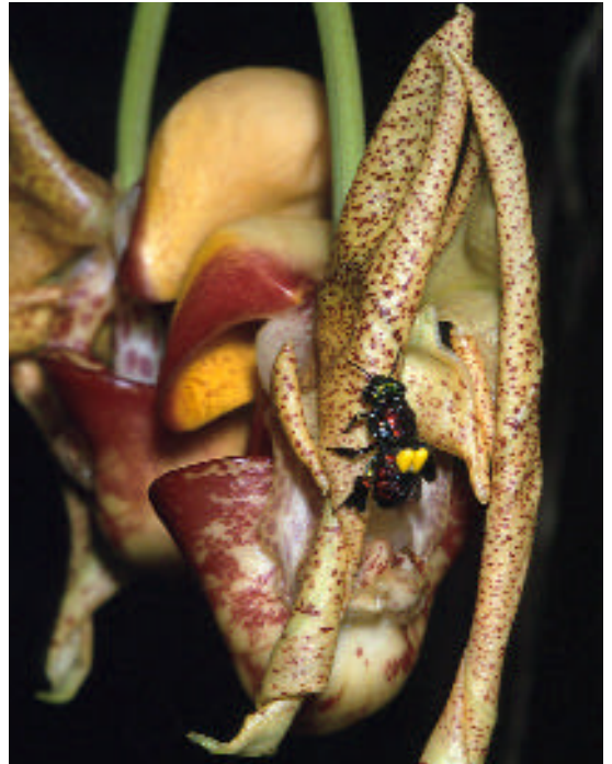
Láminas 1-3. Polinización de Coryanthes kaiseriana G. Gerlach por Euglossa allenii , 19 de Mayo 2003, Jardín Gaia, Quepos, Costa Rica. 1 - Los factibles polinizadores rodean las flores, un macho de E. allenii trata de llegar al manantial de los aromas florales debajo del hipoquilo del labelo. 2 - El polinizador está escapándose de la flor atravesando el túnel formado por el labelo y la columna. 3 - El polinizador con el polinario secándose las alas mojadas por su baño involuntario en el líquido presente en el epiquilo de la flor.